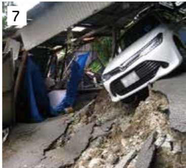
① 土砂崩れで崩壊した市道（山城町仏子）② 谷水の流入により陥没した市道（山城町平野）③ 増水により基礎部分が流出した家屋（山城町中野）④ 大規模な山腹崩壊が発生した山城町白川地区 ⑤ 県道崩壊箇所を迂回する支援物資運搬班（山城町栗山）⑥ 土石流が押し寄せた家屋（山城町上名）⑦ 地滑りで倒壊した車庫（山城町栗山）