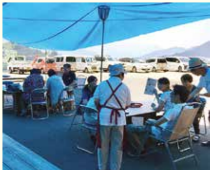
▲学校の宿あるせでの「山茶カフェ」

徳島地方法務局 (本局 088-622-4683 阿南支局 0884-22-0410 美馬支局 0883-52-1164)