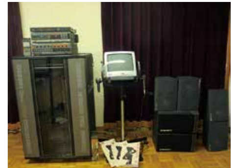
レーザーカラオケシステム