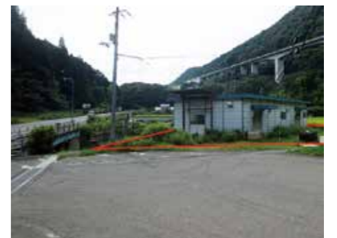
倉庫付き土地 (池田町佐野馬路境)