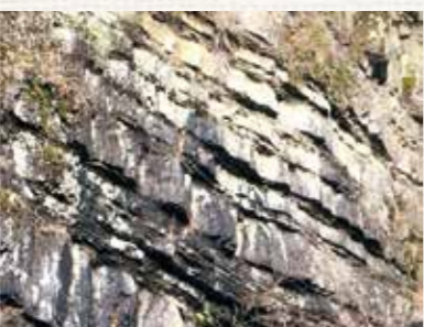
写真3：砂岩と泥岩の地層

これ以外にもたくさんの種類の岩石があります。これら色とりどりの岩石は、三好市を貫く大断層「中央構造線」の南側の大地で見ることが出来ます。一方で中央構造線の北側、つまり阿讃山脈側では、色とりどりの岩石を観ることができません。阿讃山脈側では主に、砂の地層が固まってできた灰色の「砂岩」や泥の地層が固まってできた黒色の「泥岩」しか観ることができません（写真3）。