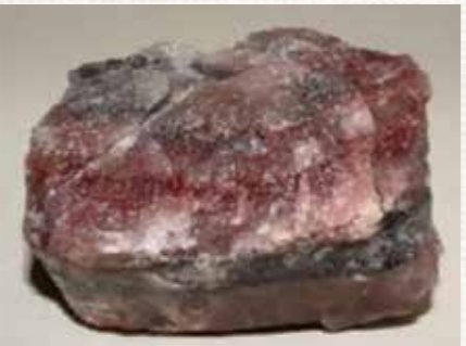
写真2：紅レン石片岩

三好市には、阿波の青石以外にも色とりどりの岩石があります。赤紫色の硬い縞模様の岩石や脆くて崩れやすい黒色の岩石など多種多様です。赤紫色の硬い縞模様の岩石は「紅レン石片岩（こうれんせきへんがん）」といって、