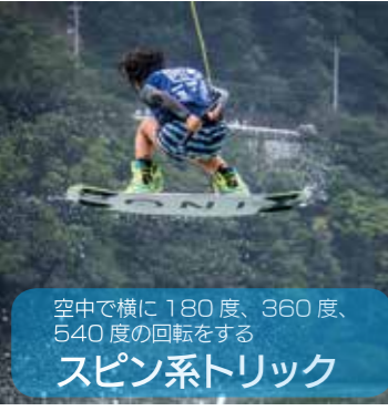
空中で横に180度、360度、540度の回転をする スピン系トリック

ウェイクボードは、エアをして、空中で様々な方向に回転するトリック(技)の難度やエアの高さを競い合うスポーツです。トリックにはいくつかの種類にわかれています。