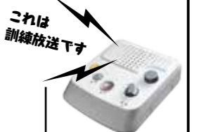
これは訓練放送です

7月5日「全国瞬時警報システム(J-ALERT)」を通じた、緊急地震速報の訓練放送を実施します。緊急地震速報を見聞きして強い揺れが来るまでの時間はごくわずかであり、短い時間にあわてずに身を守る行動をとるためには、あらかじめどのような行動をとるかを知り、実際に行動をとって経験しておくことが大切です。この機会に、ご家庭や地域などでの行動訓練にご活用ください。 【放送内容】 最初に「緊急地震速報チャイム(NHKチャイム音)」が流れます。 放送内容: 「大地震です。大地震です。これは訓練放送です。」(3回繰り返し)