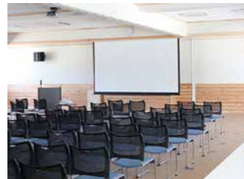
災害対策活動室〔多目的室〕

【本館】 県西部圏域での災害発生時には、広域応援部隊の活動拠点、南海トラフ巨大地震発生時には後方支援拠点となります。 【平時】 防災や健康増進に関する研修・講習会、調理実習等に住民の方にご利用いただけます。 【別館】 (平成30年中に完成予定) 【災害時】 災害時に全国から送られてくる「支援物資・配送の拠点」となります。 【平時】 運動施設としてフットサルやテニス等で住民の方にご利用いただけます。