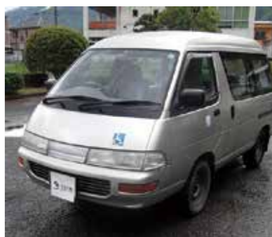
トヨタ タウンエース (車いす輸送リフト付き)

o!官公庁オークション」を利用して、公有財産の売却を行っています。今回売却を予定している物件は左の表のとおりです。詳細はヤフー(株)が提供する官公庁オークションのページをご覧ください。たくさんの方の入札参加をお待ちしております。