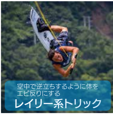
空中で逆立ちするように体をエビ反りにする レイラー系トリック