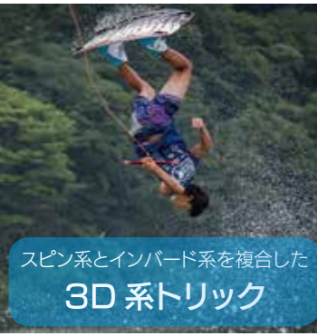
スピン系とインバード系を複合した 3D系トリック