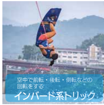
空中で前転・後転・側転などの回転をする インバード系トリック

選手はボードにつながれたロープ+ハンドルを握って引張られながら、約400mのコースを1往復します。