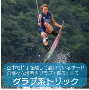
空中で片手を離して履いているボードの様々な場所をクラブ(握る)する クラブ系トリック