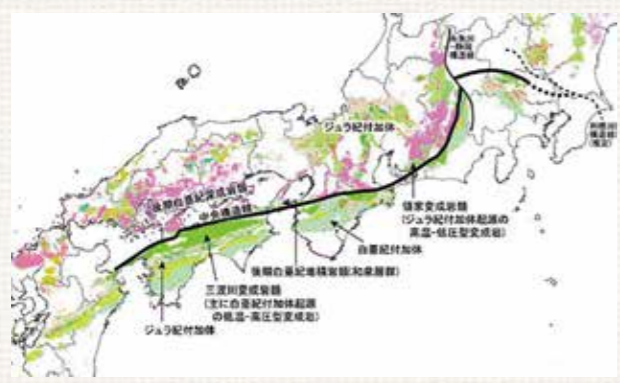
(図1) 日本列島を縦断する大断層、中央構造線