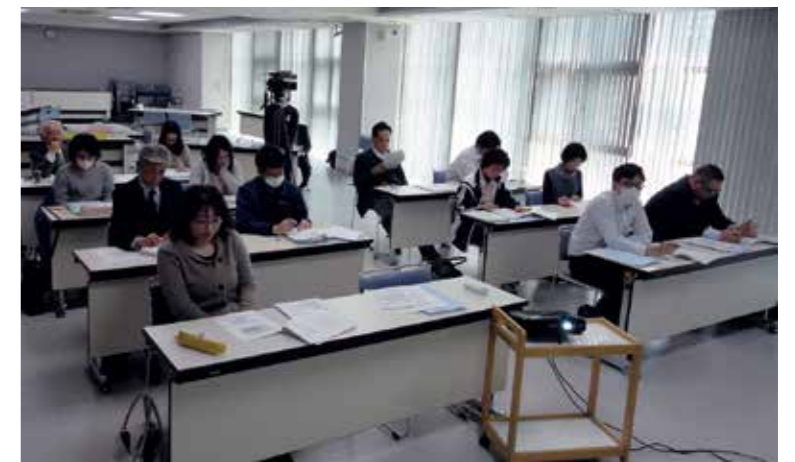
※3月23日開催のワーク・ライフ・バランス企業セミナーで県労働局の説明を受ける事業所のみなさん

得できない」(37.4%)、「賃金不払い残業(サービス残業)が当たり前になっている」(33.5%)と回答は続きます。 高卒、大卒の採用内定率は近年向上しているものの、実は就職後の現状は厳しく、ある高校の就職説明会の資料では、次のような説明がされています。 高校新卒就業者の3年以内の離職率は40.8% (厚生労働省調べ) ※大卒者の3年以内離職率は32.2% その理由として、「たとえ若くとも、高卒という学歴の壁により、転職活動が難しく、フリーターもしくは非正規になると言われている」、「一般的な退職理由の多くは、進学した友人など、周りが楽しそうなのに対し、自分(たち)はそうでないから」とされている、「キーワードは「自分に合わない」」 正規・非正規の生涯収入格差(他にも様々な試算結果あり) ○20代正規雇用者の平均年収は384万円、20代非正規雇用者の平均年収は264万円 ○生涯年収の差は、単純計算で9000万円以上とも… ○非正規の収入で結婚や子育ての費用を捻出することは容易ではない ○派遣社員をはじめ、製造業、販売員の募集は事実上30歳代が上限 ○早々と社会保障のお世話になる可能性も… 資料の最後に、「正規・非正規の違いは能力ではない!という現実」と書かれていました。