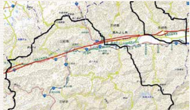
(図2) 赤線部分が三好市を貫く中央構造線

まだアジア大陸の縁にくっついていました。もちろん今のような三好市の地形は無いですが、その基盤である石ころ(地質)も地表にありませんでした。その後、日本列島の基となる大陸の縁の断片がアジア大陸から離れて島国を作ります(約1400万年前)。中央構造線の活動(地震)がずっと継続されていたかどうかについては、様々な意見があり明確にはなっていませんが、今から約250万年前には、現在のような中央構造線の活動(地震)による断層の向こう側が右に横ずれする動き)になったと考えられています。