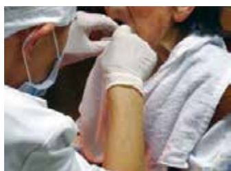
88歳独居女性 在宅療養中

このような歯と口腔のケアを続けたこの1年間は顎骨炎を起こすことなく、もちろん入院もせず、在宅生活を続けています。「口腔内を清潔に保つことは、からだ全体の健康につながっている」と実感しています。