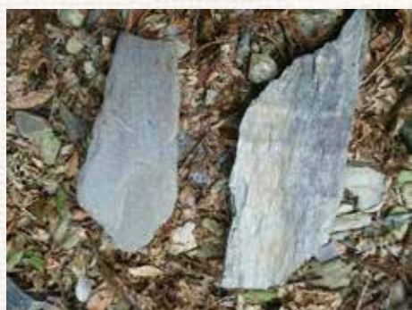
写真2：砂質片岩（左）と泥質片岩（右）

傾斜地集落は緩やかな斜面に作られていることが多いです。そしてその緩やかな斜面の大半は地すべりが起きて作られたものです。地すべりはどこでも起きるわけではありません。ひの字溪谷あたりの石は硬い石（砂質片岩）から作られています。一方で善徳や今久保地区では一定方向に剥がれやすい石（泥質片岩）から作られています（写真2）。