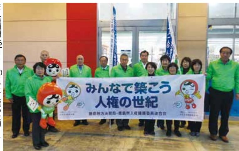
※人権週間(12月4〜10日)に人権の大切さを街頭で訴えた人権擁護委員のみなさん

21世紀を真の「人権の世紀」にするためにも、すべての人々の人権が尊重される社会をめざして、一人ひとりが身近なことから自分のこととして人権を考えていきましょう。自分の人権を守り、他人の人権を守ることが他の人の人権を守ることにつながるのです。