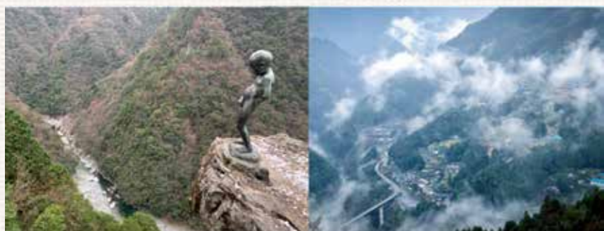
写真1：傾斜地集落のない風景（左：祖谷溪）とある風景（右：善徳）

傾斜地集落は緩やかな斜面に作られていることが多いです。そしてその緩やかな斜面の大半は地すべりが起きて作られたものです。地すべりはどこでも起きるわけではありません。ひの字溪谷あたりの石は硬い石（砂質片岩）から作られています。一方で善徳や今久保地区では一定方向に剥がれやすい石（泥質片岩）から作られています（写真2）。