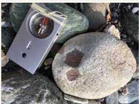
写真3：岩石の中にある六角形の赤い石（ガーネット）

したがって、山城町の大野小学校の下の河原に降りると三好市の他の川では見られないような石をたくさん見つけることができます。その中に、赤色の斑点模様の石があります（写真3）。