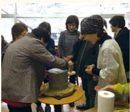
▲福祉施設での茶臼体験講座

フェ」は今年度の第一回目を、新茶の時期の5月27日(日)に西祖谷「栗校の宿あるせ」にて行います。その他、市内外で和菓子細工のワークショップを行う中で、菓子と共に地元産の茶の美味しさを味わっていただく活動も続けています。三好市に住んで丸2年、最近、日々目にしていく景色の素晴らしさを改めて感じています。季節や情景を感じられるのも和菓子の魅力の一つであって、まだまだ勉強中ではありますが、今後はこういった景色を表現することにも挑戦していきたいと考えています。