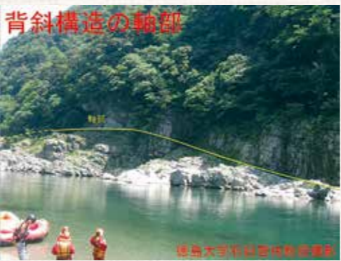
大歩危（室床）の背斜構造

地球のプレート運動によって地下深くに運ばれ、圧力を受けてできた岩石です。そしてその結晶片岩が地下深くから盛り上がり、大歩危・小歩危周辺の高い山々が作り出されました。この過程を知ることが出来る証拠の一つとして、大歩危・小歩危には馬の背のように盛り上がった背斜構造があります。