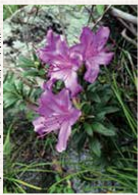
溪流沿い植物のひとつ「キシツジ」

この植物は、川幅が狭く、多くの雨によって増水を繰り返すような渓谷という過酷な環境でたくましく生息しています。ほかの環境に生える植物と比べる