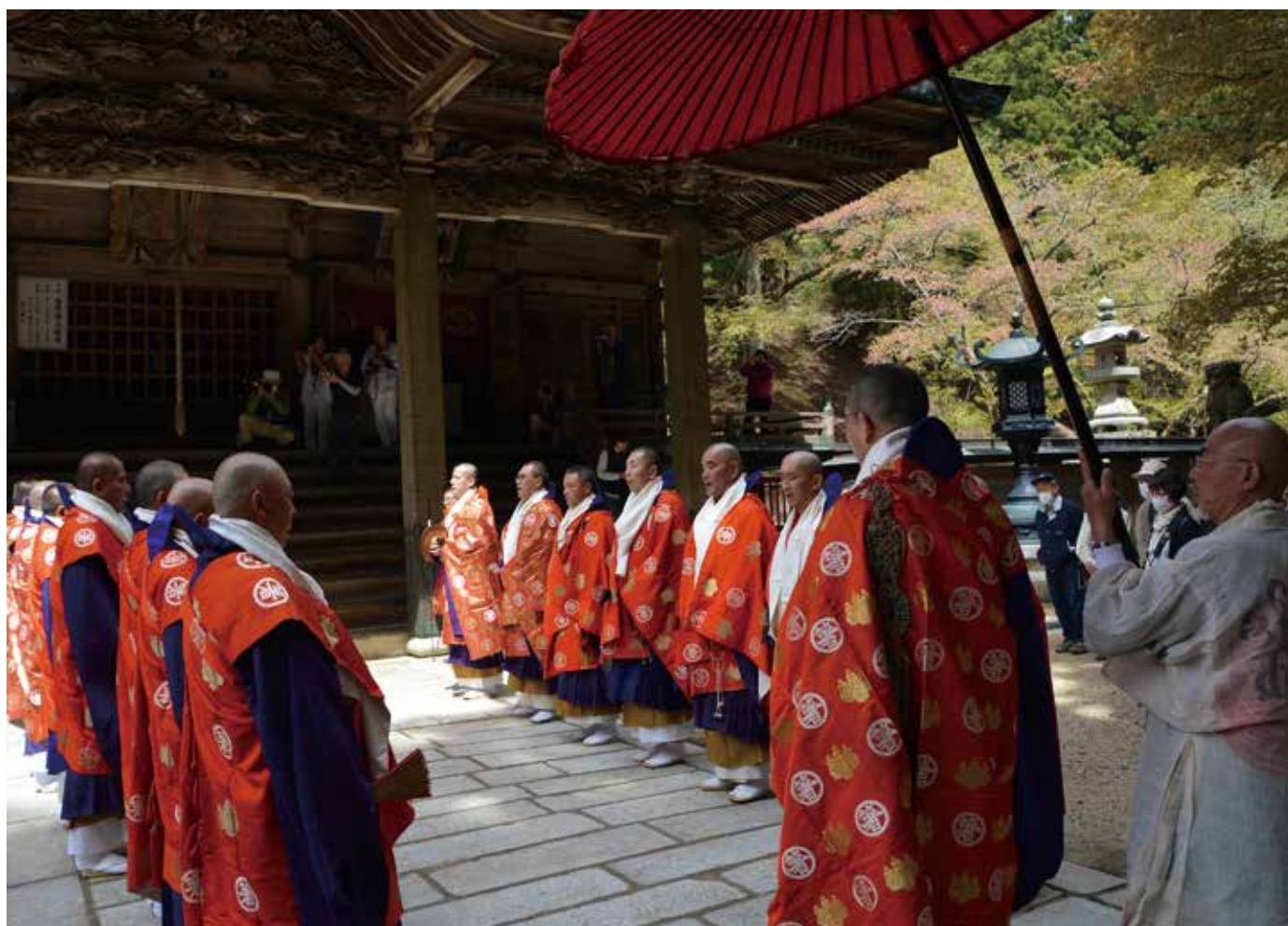
箸蔵寺春の大祭（4月12日撮影）