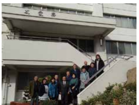
※ 受刑者が生活する友愛寮を見学

後の社会への適応能力を育成することにあり、職業訓練としてもガス溶接技能講習、玉掛技能講習、危険物取扱者乙種第4類、フォークリフト