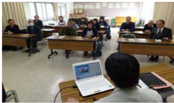
※ 大井造船作業場内で研修を受ける人権擁護委員の皆さん

ます。全国の刑務所から厳しい選考に合格した模範的な受刑者がここに送られ、現在約20人が収容されています。来るまでに15日間の訓練を受け、大井作業所に来ても15日間の訓練を受けています。