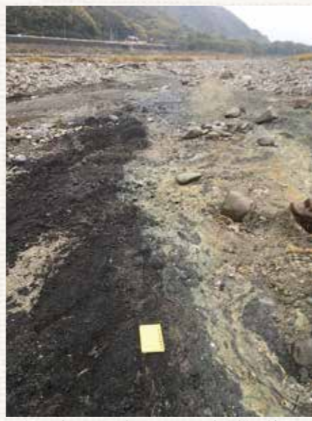
写真1：東みよし町加茂に現れた中央構造線露頭。写真奥に道の駅三野が見える。

で、長さが約40メートル、幅が約16メートルの大規模な露頭です（写真1）。この露頭から東へ向くと道の駅三野を眺めることができ、三野町太刀野の中央構造線につながることを実感することが出来ます。写真1の中で、黒い部分（左）が中央構造線の北側の大地を作る石が破碎されたもので、白い部分（右）が中央構造線の南側の大地を作る石が破碎されたものです。 この大規模な露頭は、昨年7月の集中豪雨時に吉野川が増水したことによって川の土砂が運ばれ、現れました。現在、これだけの大規模でフレッシュな中央構造線が観られるのは三好郡市でここだけです。 お問い合わせ先 三好市地方創生推進課 ☎72-7607