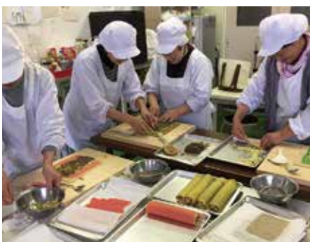
有瀬での和菓子試作

いずれの取り組みでも、応援協力してくださる地域の方々に助けられ、その背景には協力隊をはじめ、これまでに移住し活躍され