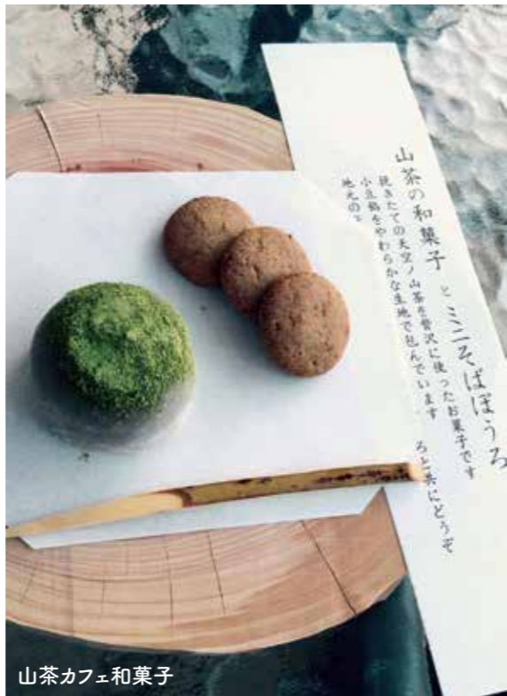
山茶カフェ和菓子

今後は、地域の価値の多様さを増やしていきたいと思っています。趣のある古民家や美しい渓谷は人気ですが、異なる文化圏の人からみると同じ場所でも全く見え方が違うように、人によっては植生、霧、石も興味深いものとなります。地域を訪れる価値観の多様性が増えると、地域の価値の多様さもまた増加します。そのために、世界各国の人々に向けて、地域の暮らしや文化を軸とした体験プログラムを運営していきます。また、世界農業遺産に認定されたこの地では持続可能な農業、暮らしが息づいています。現実として少子化や高齢化という現状はあるものの、そういう部分も含めてこの地域を