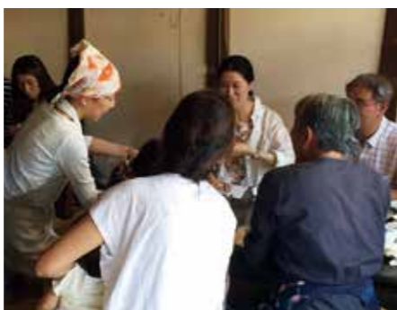
うだつマルシェワークショップ

てきた先輩方の存在も大きくあったと感じています。 【今後について】 ようやく思っていることの実現が少しずつできるようになってきたところです。こちらでいただいたご縁を大切に、これからも三好市を拠点として、これまでの活動を継続、発展させていきたいと考えておりますので、今後ともよろしくお願ひします。