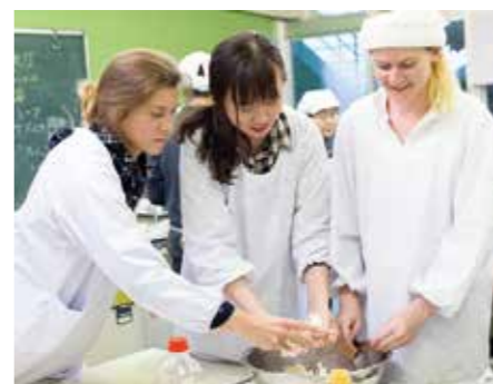
地域イベント調査

てきた先輩方の存在も大きくあったと感じています。 【今後について】 ようやく思っていることの実現が少しずつできるようになってきたところです。こちらでいただいたご縁を大切に、これからも三好市を拠点として、これまでの活動を継続、発展させていきたいと考えておりますので、今後ともよろしくお願ひします。