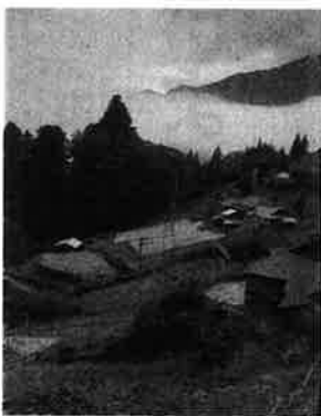
▲山間部で暮らす高齢者への支援が必要です。

電気を止めた家庭について、電力会社と自治体が連携して情報共有するなどの対応は、個人情報との関係で難しいようです。これらの問題点を県や国に要望し、命を守る体制整備を求めています。