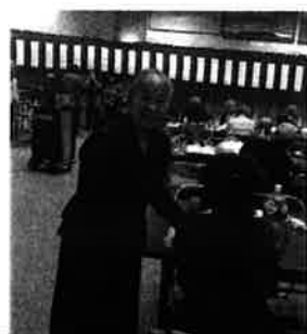
敬老会でみなさまから元気をいただきました!