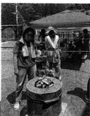
祖谷のじゃがいもと豆腐で作った「でこまわし」の出来上がり待つ。子育て仲間と郷土料理を味わいました。