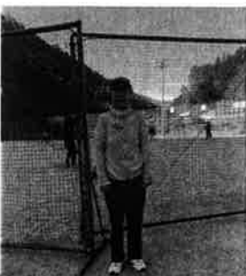
地元のソフトボール大会に参加しました。

みなさんは、秋といえは何を思い浮かべますか。実りの秋、芸術の秋、スポーツの秋。秋は行事やおいしい食べ物がたくさん。つつい食べすぎて体重も気になるところ…。今年も三好の秋を楽しみました。