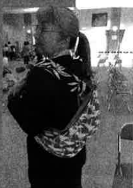
第7回東祖谷福祉まつりに参加。ダンスに眠っている風呂敷を使って作ったリュックサック。緊急時に役に立ちます。