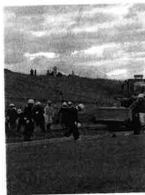
▲大規模災害を想定した防災訓練を見学(9月三野町)