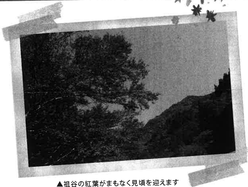
▲祖谷の紅葉がまもなく見頃を迎えます