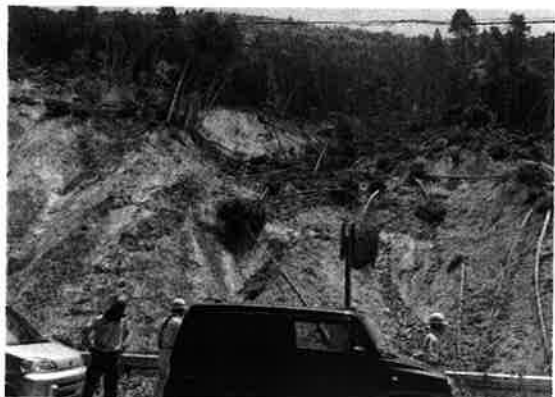
▲7月19日、西日本豪雨災害に見舞われ大規模な土砂崩れがおきた山城町へ。白川谷川沿いの県道付近の家は崩れた土砂で浸水被害を受けました。