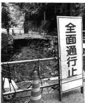
▲決壊した東祖谷椋尾の国道

すべての子育て世帯を対象に、子育ての不安を相談でき、親子が集える場の提供が期待されています。