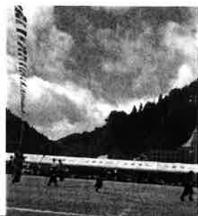
晴天に恵まれ運動会で楽しいひととき、いい汗をかきました。