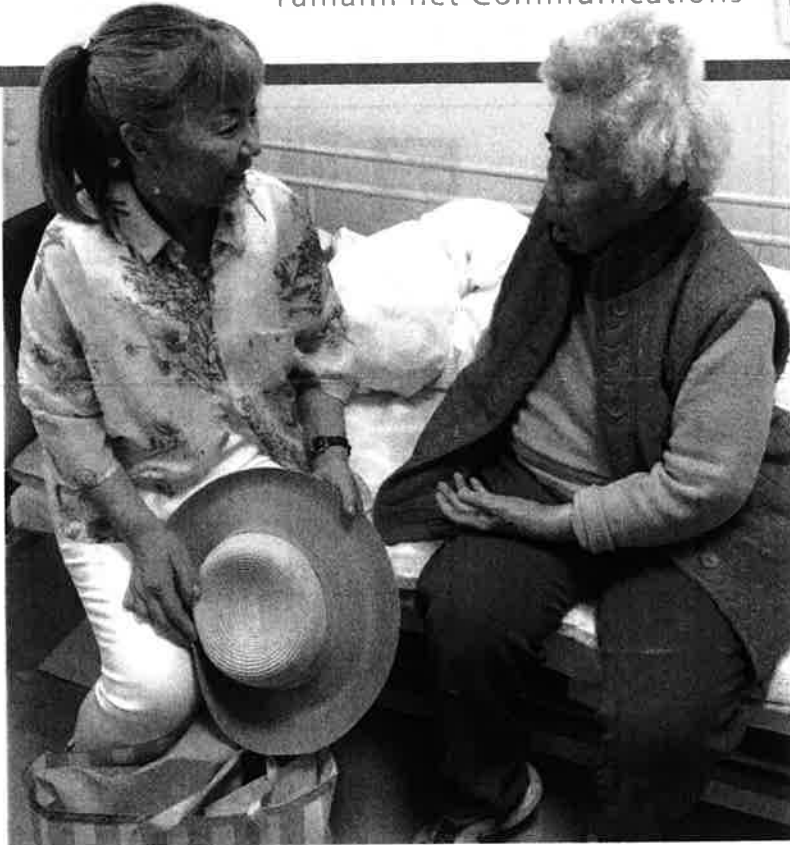
7月2日、ふるさと三好市を離れて県外の施設に入所している女性を訪ねました。昔話に花が咲き、楽しい時間を過ごしました。