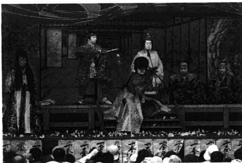
大鹿歌舞伎（大鹿村）

○当ジオパークは日本で唯一、エコパークエリア内にすべてのジオパークエリアが重複しているジオパークとなります。大地に重点を置くジオパークと生物に重点を置くエコパークの双方の活動による相乗効果を、教育・環境面に活かしていきます。