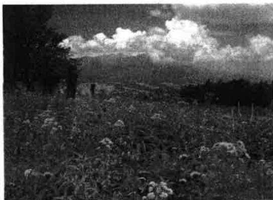
入笠湿原（富士見町）