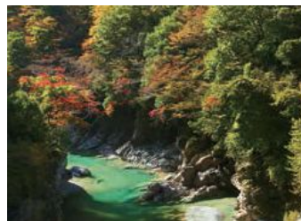
祖谷溪谷が中ほどの峯を挟んで、ひらがなの「ひ」の字に見える「ひの字溪谷」。世界に認められた溪谷美の代表です。