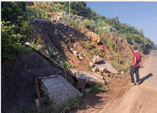
【写真1】豪雨で被害にあった西予市のジオパーク

ジオパークの活動では、持続可能な形で将来の子ども達へ地域の良さを引き継いでいくために、地域の特徴ある大地の資源(地質や地形)やそれと関わる歴史文化や生態系を活用し、教育や保全、ツーリズムを行います。さらに大地は時に災害を引き起こすため、災害に対する活動も行っています。とりわけ日本は火山や