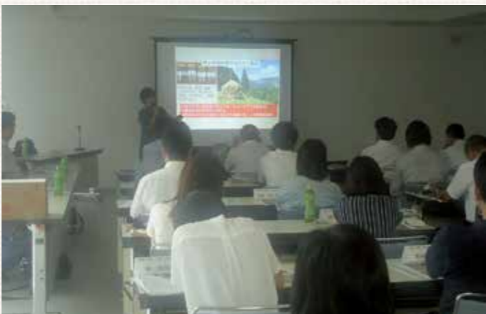
【写真2】学校(園)防災ネットワーク会議

また、三好市で起きた土砂災害についても情報を共有し、地質や気象条件による災害発生の違いなどを意見交換しました。平時では、西予市の観光地として活用されているジオパークの見どころ(ジオサイト)も昨年度の豪雨で5箇所被害に遭い、いまだに活用できない状態であり、これをこれからどう活かすかを話し合いました。(写真1)