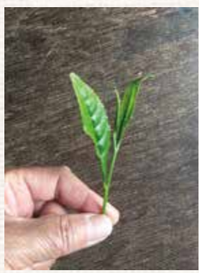
写真2：手摘みされた山茶（二芯双葉）

ほどのキツイ斜面もあります。茶摘みの方法は、古くなった葉の上に成長した若葉と茎（二芯双葉）を摘みます（写真2）。