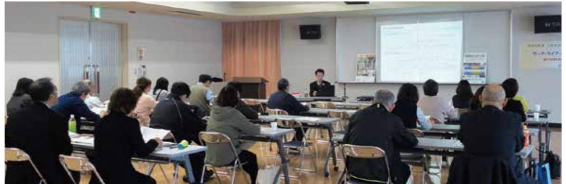
写真：ワーク・ライフ・バランスと働き方改革の講演を受ける事業所のみなさん