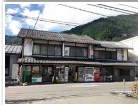
登録有形文化財 喜多薬店 (西祖谷山村一字)