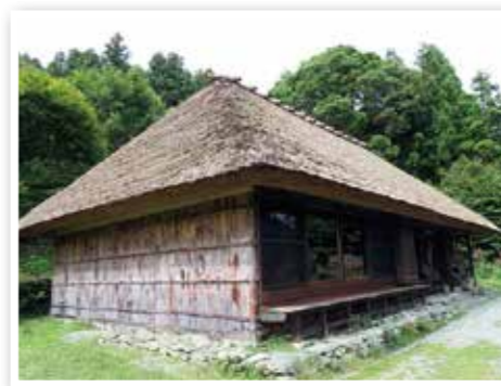
登録有形文化財 ちいおり 麓庵住宅 (東祖谷釣井)

昨年9月10日、三好市内の建造物3件が国の登録有形文化財に登録されました。登録された建造物は東祖谷の麓庵住宅と河井百貨店、西祖谷の喜多薬店で、2月3日に建造物の所有者に市教育委員会の竹内教育長より登録プレートが手渡されました。東祖谷釣井に建つ麓庵住宅は、空き家の住宅を昭和48年にアレックス氏が購入した江戸中期に建てられた木造平屋建ての寄棟造り茅葺きの建物です。石垣で構成された敷地に、茅葺き屋根にヒシャギ竹の外壁という祖谷地方の伝統的な外観を有する貴重な建築物です。東祖谷支所向いにある河井百貨店は、昭和9年に良質な大きな木材を使って建てられた木造2階建ての入母屋造りの建物です。部分的な改変は見られるものの、建築当時の姿を残しており、京上の昭和時代の賑わいを知る上で貴重な建築物です。喜多薬店は宿場町として栄えた西祖谷山村一字に位置し、昭和15年に建てられた木造3階建て切妻造りの建物です。昭和7年から、この地区最初の薬種商を開業してから現在も営んでおり、今日まで変わらない姿を見ることができる貴重な建築物です。今回の登録で、三好市内の登録有形文化財(建造物)は合計49件になりました。