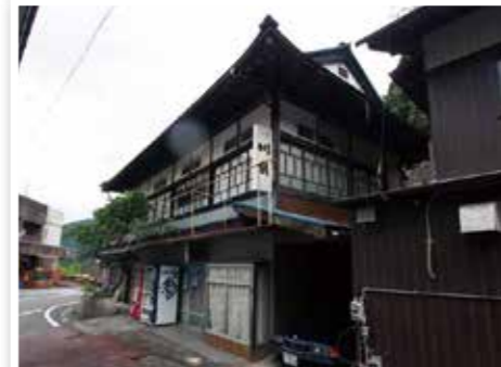
登録有形文化財 河井百貨店 (東祖谷京上)