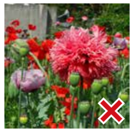
ソムニフェルム種▲