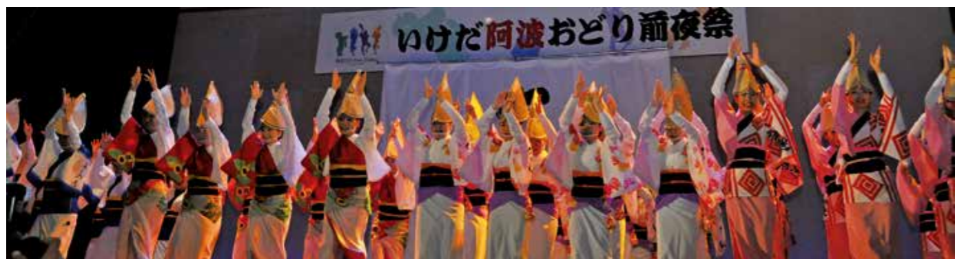
※「出会い★ときめき 三好のこの人」はケーブルテレビでも、タイアップ放送しています。ぜひご覧ください。

みなながら自分たちが楽しめたらいいかなという感じだったけど、最近では「見せる踊り」をどう演出するか、どの連も日々工夫し努力しています。そうやっていいものをつくり上げていく中で、阿波踊りの奥深さを常々感じています。 前夜祭含めて四日間、見どころ満載! 今年の枚敷はすごいですよ。いけだ阿波おどり観光連の4連がひとつとなり、総踊りで枚敷席を踊り抜けます。そりゃ、すごい迫力になると思いますよ。公式には初めての取り組みだけど、ぜひやりたいと思ってるんです。なんと、池田の枚敷席は踊り子と観客の距離がとてに近い。一緒に触れ合いながら楽しめるんです。これは魅力です。前夜祭もこれまで以上に趣向を凝らして、みなさんに喜んでもらえるステージにしていきたいと思えます。 常に新しい取り組みで盛り上げたい 今までやらなかったことをやるには、「パワーと協力」が絶対必要。徳島市のようなスケールはなくても、新しいことをどんどん取り入れて、いけだ阿波おどりをみんなで盛り上げていきたいですね。どの連も、最近連員の減少が心配されています。できるなら、小学生のちびっこから高校を卒業するまで、ずっと続けて踊ってほしいものですね。せっかくの郷土芸能です。 みなさん、一緒に踊りましょう。