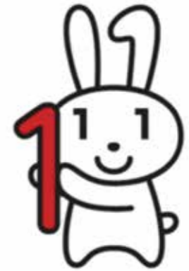
マイナンバー 広報キャラクター 「マイナちゃん」