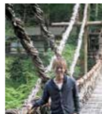
▲テレビのロケでかずら橋 ※平成27年1月13日からかずら橋の架け替えが行われます。

使に就任していたときで、シラクチカズラで編んだ吊り橋を見た驚きと約800年前から架けられてる歴史に興奮しました。雨の中で少し怖かったのですが、一緒に居たレコード会社の方々と渡り、橋を少し揺らすなどいたずらしてしまつた事を覚えてます。そんな思い出があるかずら橋の材料シラクチカズラを中学校では毎年植樹を行っている聞き、生徒の皆さんも観光のために貢献し、三好市を支えてくれる事をとても頼もしく思っています。そして私たちが植えたシラクチカズラが何十年後には、かずら橋になっているんだと思うと、楽しみに見守りたいと思います。また、三好市の多くの方が支え守ってくれている祖谷のかずら橋にたくさんの方が訪れてくれるよう心から応援していきます。