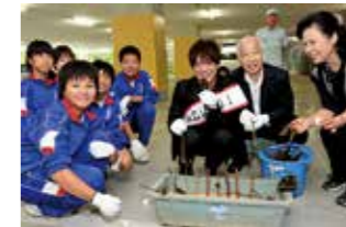
▲西祖谷中学校の生徒とシラクチカズラの植樹