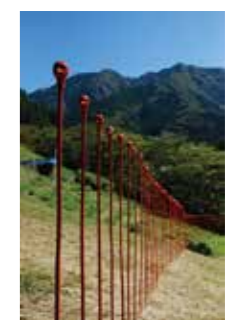
▲マチトソラ芸術祭のアート作品（東祖谷落合）

などの声を聞きました。参加していただいた皆さん、本当にありがとうございます。美しい三好の風景、魅力的な人たちに会いに来てほしい。来訪者と地域の人々を繋げていけるような企画を続けていきたいと思っています。また「デアイ版画プロジェクト」では220点ほどの三好市の版木が、徳島県立博物館の学芸員さんのご協力により、三好市に里帰りしてきました。出合小学校の体育館で版画を刷らせてもらったのですが、多くの参加者の皆さんに助けていただいて、大量の版画を一日ですることができました。この昔から残る三好の版木の活用法や、版画の新しい魅力を発見できるようにワークショップも企画していきますので、どうぞご参加ください！