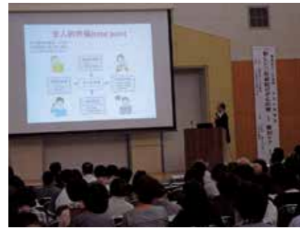
▲緩和ケア内科 安藤勤 医師