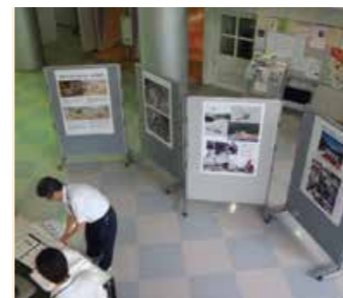
▲ポスター展示の様子