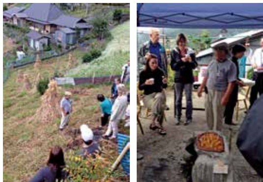
▲コエグロとそばの花 ▲庭先でひらら焼き

9月も後半が過ぎ日中も過ごしやすいくらいになってきました。日が暮れるのも早くなり段々と夏の終わりを感ずる季節になってくるようになりました。 落合集落を訪れる外国人ツアーも今回で4回目。地域の人も段々慣れてきて「こんなやつたら？」と、色々なアイデアを出してくれるようになり、落合集落の皆さんと一緒にツアー客を迎えるのが毎回楽しみです。 今回は集落の方から出たアイデアで、自宅の庭先でひらら焼きと呼ばれる粗合・大歩危地方の郷土料理を庭先で作ってみました。当日は小雨が降る中で少し肌寒く、ちょうど周りで食をとりながら皆さんで囲んで食