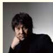
音楽作曲:住友紀人