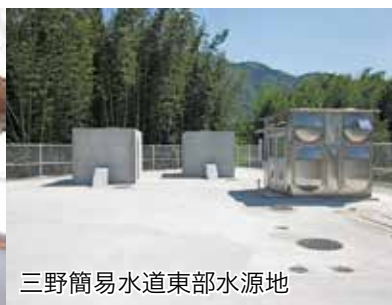
三野簡易水道東部水源地