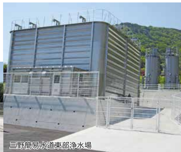
三野簡易水道東部浄水場

三野町加茂野宮地区において、建設を進めてきました東部水源地および東部浄水場が完成いたしました。完成した施設の概要は次のとおりです。