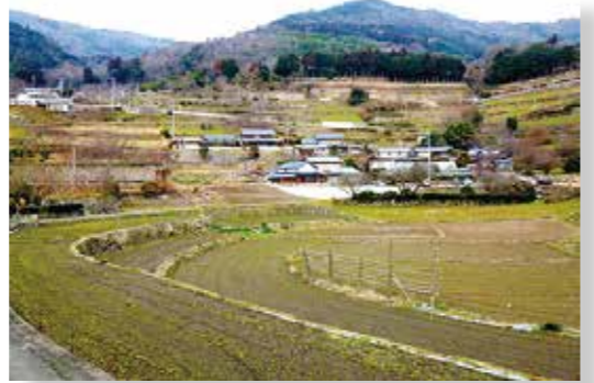
▲米づくり体験をスタートする西山の田んぼ

皆さんいかがお過ごしですか。私は初めて経験する三好の春を満喫しています。さて、今日は宣伝と新プロジェクトの紹介です。まずは、「みよしてぬぐい」。ご覧になった方もおられるかもしれませんが、市報ではまだ案内していませんので、ご紹介いたします。昨年の11月に三好市と協力隊のPRをかねてデザイン・製作したぬぐいで、うだつマルシェで初お目見えさせて以来、市内・近隣の観光施設で好評販売中です(1枚800円)。2月22日のマルシェでは、色ちがいのピンク