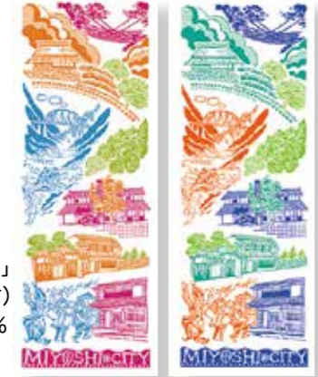
▶「みよしてぬぐい」ピンク(左)と青(右)の2種類。綿100% サイズ約34×90cm

皆さんいかがお過ごしですか。私は初めて経験する三好の春を満喫しています。さて、今日は宣伝と新プロジェクトの紹介です。まずは、「みよしてぬぐい」。ご覧になった方もおられるかもしれませんが、市報ではまだ案内していませんので、ご紹介いたします。昨年の11月に三好市と協力隊のPRをかねてデザイン・製作したぬぐいで、うだつマルシェで初お目見えさせて以来、市内・近隣の観光施設で好評販売中です(1枚800円)。2月22日のマルシェでは、色ちがいのピンク