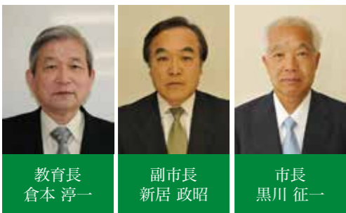
市長 黒川 征一