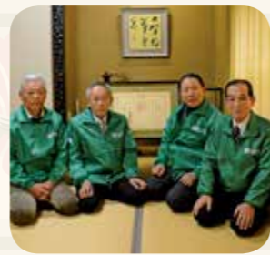
箸蔵でんがく会 (池田町州津)

昭和32年の発足以来、60年にわたり三好市池田町箸蔵地区で、祭りの準備、河川清掃、学童登校時の声掛けなどのさまざまなボランティア活動に尽力されてこられました。現在の会員は50～80代の25名。長きにわたる地域に密着した活動で、地域環境の向上や地域交流の推進に大きく寄与されました。