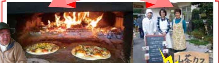
No.19 ピザ作り & 山茶体験

上野写真館アトリエは親子向け写真講座を開催します（No.11）。由緒ある旧政海旅館でベストショットを狙ってみましょう。歴史好きにおすすめなのが、三野町にある歴史ロマンを堪能ください! 三好長慶プログラム（No.15）。甲冑着用で、気分も高めて。そのほか、着付け教室（No.16）や、焙煎講座（No.12）など、盛りだくさん。指導を受けてスキルアップを目指しましょう。