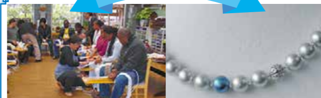
No.2 布ぞうり作り No.3 藍染めのパールのリボンネックレス

毎回人気の布ぞうり作り（No.2）のほか、3Dプリンター工作体験（No.8）や藍染めのビーズを使ったリボンネックレス作り（No.3）など、珍しいプログラムも並びました。興味に合わせて、自分だけのグッズ作りを楽しんでみましょう。