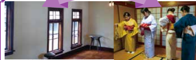
No.11 旧政海旅館2F 上野写真館アトリエ No.16 着付け体験

上野写真館アトリエは親子向け写真講座を開催します（No.11）。由緒ある旧政海旅館でベストショットを狙ってみましょう。歴史好きにおすすめなのが、三野町にある歴史ロマンを堪能ください! 三好長慶プログラム（No.15）。甲冑着用で、気分も高めて。そのほか、着付け教室（No.16）や、焙煎講座（No.12）など、盛りだくさん。指導を受けてスキルアップを目指しましょう。