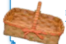
No.5 エコクラフトの小物入れ作り

毎回人気の布ぞうり作り（No.2）のほか、3Dプリンター工作体験（No.8）や藍染めのビーズを使ったリボンネックレス作り（No.3）など、珍しいプログラムも並びました。興味に合わせて、自分だけのグッズ作りを楽しんでみましょう。