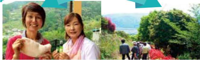
No.34 アイピロー&スプレー作り No.35 ウォークラリー

屋内にこもりがちな季節には親子で体と頭を動かす、健康とふれあいの森のウォークラリーがおすすめ（No.35）。広い遊歩道を回って、親子で元気にコースを攻略しましょう。とりの巣カフェでは、ラベンダーと三好市の松を使って安眠グッズを作ります（No.34）。良質な睡眠を手に入れて健康美人になりましょう。さらに、UB1では、2日間講座で、なんとアロマオイルの抽出も体験できます（No.33）。