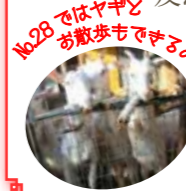
No.28 ではヤギとお散歩もできるよ!

親子で楽しめるプログラムもあります（No.20、No.28）。友だちも誘って参加してみましょう。そのほか、内容盛りだくさんの楽しいプログラムが揃いました。ぜひ参加して、皆でにし阿波を楽しみましょう!