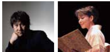
音楽作曲：住友紀人 朗読：山下智子