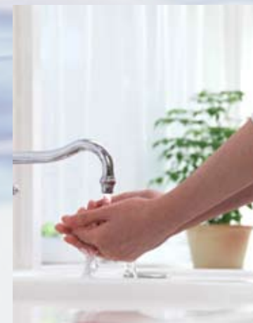
■水道水ができるまで(上水道の例) ※地区によって方式は異なります

365日24時間体制で機器の運転や管理業務を行っています。また、日頃私たちが使用している水は、いくつもの水源地の原水から各水道施設でのさまざまな工程を経て、私たちの家庭などに届けられています。