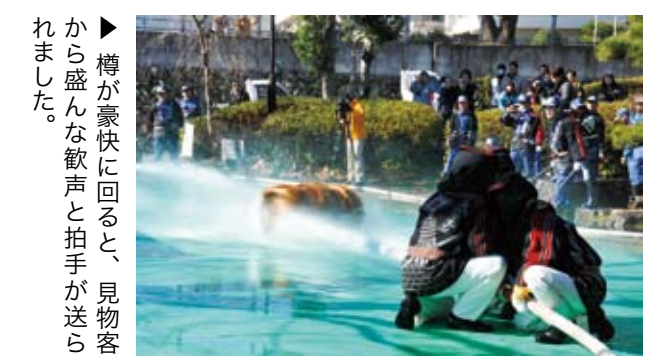
▶樽が豪快に回ると、見物客から盛んな歓声と拍手が送られました。