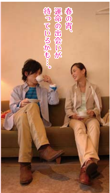
春の宵、 運命の出会いが 待っているかも...