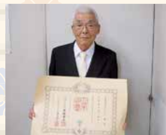
高齢者叙勲 瑞宝双光章

昭和 20 年川崎小学校代用教員として赴任され、昭和 63 年に池田第一中学校長として退職されるまでの長きにわたり、戦前から戦後と激変する社会のなかで、子どもたちの健全育成にご尽力されなど地域の教育に多大な貢献をされました。