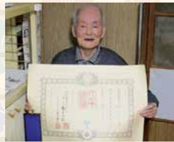
高齢者叙勲 瑞宝双光章