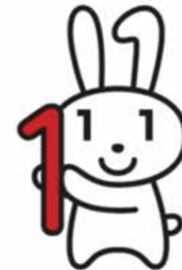
マイナンバー 広報キャラクター 「マイナちゃん」