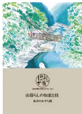
▲三好の魅力発信マガジン「みよしの肴」創刊号。1ネタ1冊子の読み切りサイズで発行していく予定。

一年で一番美しい季節になりましたね。皆さまいかがお過ごしですか。さて協力隊も最終年度になりました。これまで活動するなかで出会った三好の魅力を残しておきたいと考え、三好の魅力発信マガジン「みよしの肴」を発行することにしました。観光スポット、食、暮らし、人、その他地域の素敵なストーリーを取り上げて描きイラストで紹介していきます(不定期刊行)。創刊号は三好の代表選手、かずら橋を取り上げています。マガジンは観光協会、観光施設などに設置していますので、ぜひお手にとってご覧ください。ただいまご意見・ご感想大募集中です。抽選で10名様