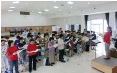
三好市民第九合唱団(ある日の練習風景) 平成18年設立。「三好市合併記念フロイデコンサート」「国文祭1周年記念コンサート・しあわせはふたたび」「四国第九コンサート」など年々実績を上げている。

第九それは「歓喜のうた」 私たちが歌っているベートーヴェンの交響曲第九番の合唱はドイツ語です。「友よ、喜びに満ちた調べに声を合わせて歌おうではないか」という呼びかけに「歓び?」と返し、男性の独唱者が「歓喜の歌」を歌い出します。最後はみんなで♪アッレメンシエンヴェルデンブリューダー♪♪「すべての人々は兄弟となる」と、合唱と独唱者とオーケストラが会話