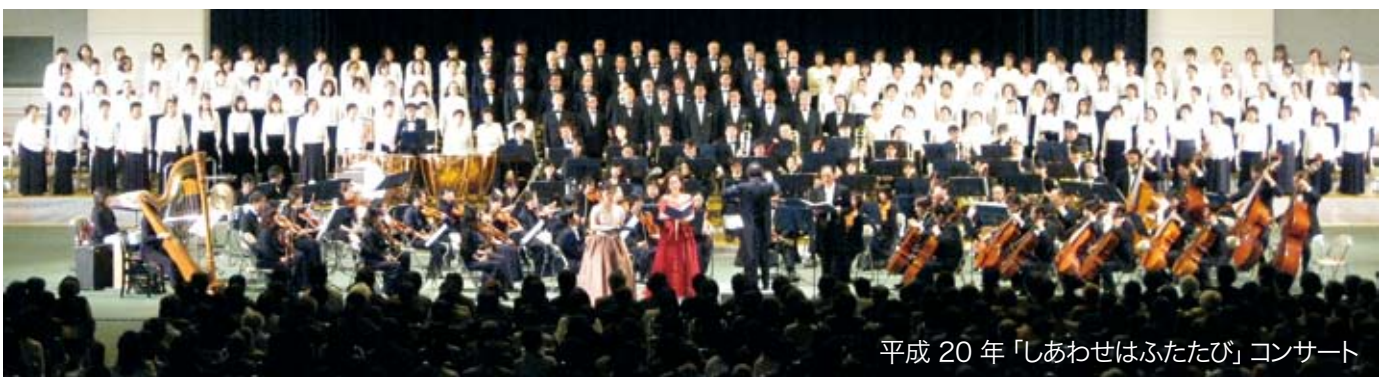
平成20年「しあわせはふたたび」コンサート

しながら感動的な人類愛を歌い上げる曲です。 第四章まで続く74分間の音楽劇、歌い終わったら観客の皆様の拍手でホール全体が喜びで一つになります。 「第27回国民文化祭」に向けて 今秋11月3日文化の日に「第27回国民文化祭 まちが奏でるクラシック in 三好市」の公演が予定されています。指揮者は円熟の世界的指揮者の秋山和慶さん。オーケストラは昨年9月に結成された「とくしま記念オーケストラ」。そしてオペラ歌手の小濱妙美さんをお迎えし、合唱団の音楽交流で鳴門市・阿南市などから第九の仲間も友情出演していただけるということで、我々合唱団は大変な緊張感と期待感で胸をふくらませています。