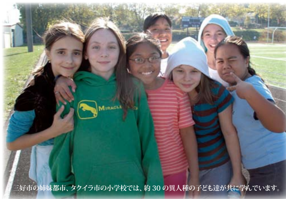
三好市の姉妹都市、タクイラ市の小学校では、約30の異人種の子ども達が共に学んでいます。

法務省及び全国人権擁護委員連合会では、「人権デー」を最終日とする1週間（12月4日から10日まで）を「人権週間」と定め、世界人権宣言の意義を訴えるとともに人権意識の高揚に努めています。