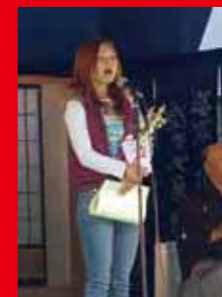
粉ひき節日本一大会