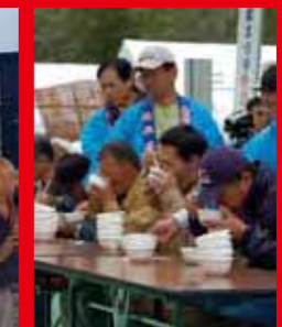
祖谷そば早食い大会