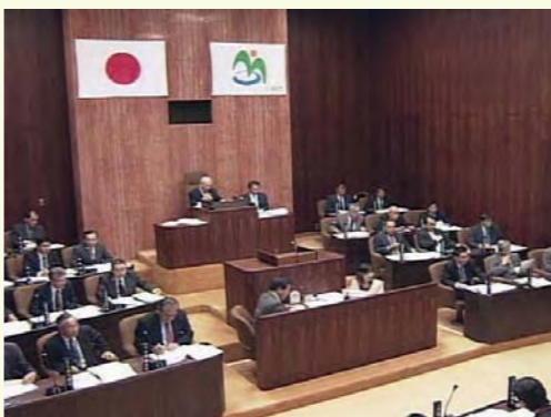
自主放送による市議会中継がご覧いただけます

ケーブルテレビが制作する地元中心の番組をご覧いただけます。三好市のニュースや三好市議会及び県議会中継、学校・地域の行事や阿波踊り等、身近な話題を放送します。