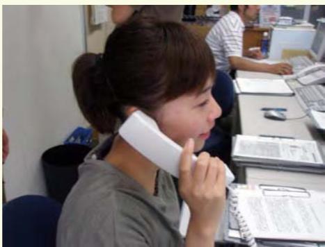
IP電話は加入者間の通話が無料となります。

050で始まる番号を取得していただくことで、市外へも低料金で電話をご利用できます。 ※110番、119番等の緊急電話を含む一部の番号にはかけることができません。