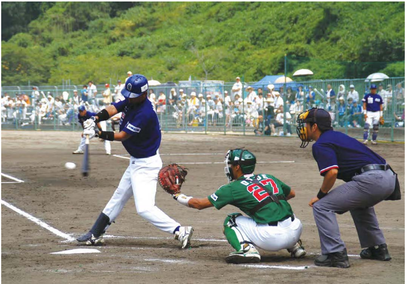
三好市合併 1 周年記念 四国アイランドリーグ公式試合

ざつ紙は貴重な資源です 市有財産の売却について テレビ放送に出演しませんか 池田中の校歌・校章募集 まちかどフォトニュース