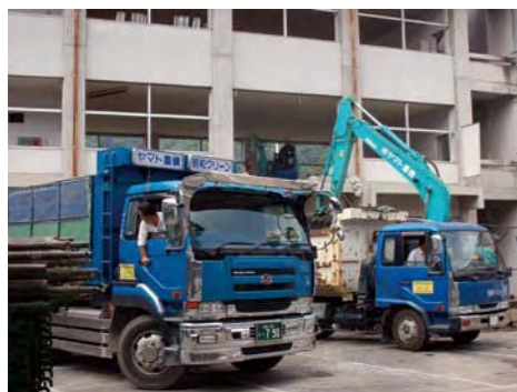
新校舎の建築に向け、解体工事が開始された池田中学校