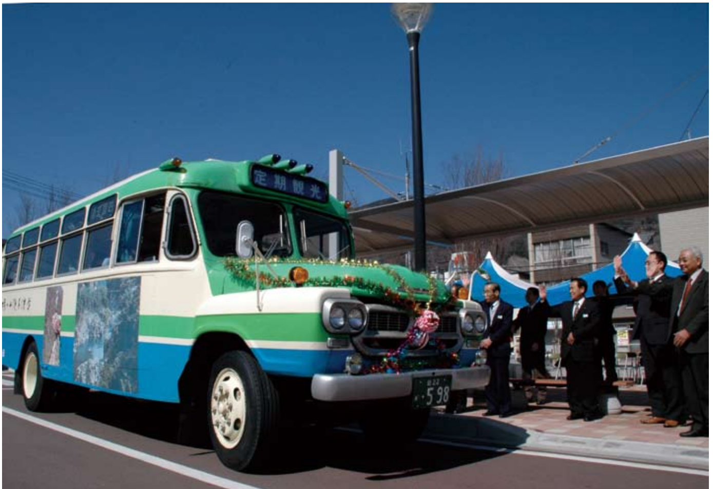
定期観光バス発車式 (13 ページ)

県知事・県議会議員一般選挙 市報が変わります 農山村体験受入家庭を募集 こんにちはは人権室です まちかどフォトニュース