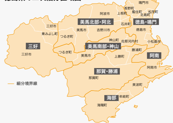
徳島県の二次細分区域図

このような大雨の発生が予想されると大雨注意報や大雨警報などを下記の二次細分区域で発表します。