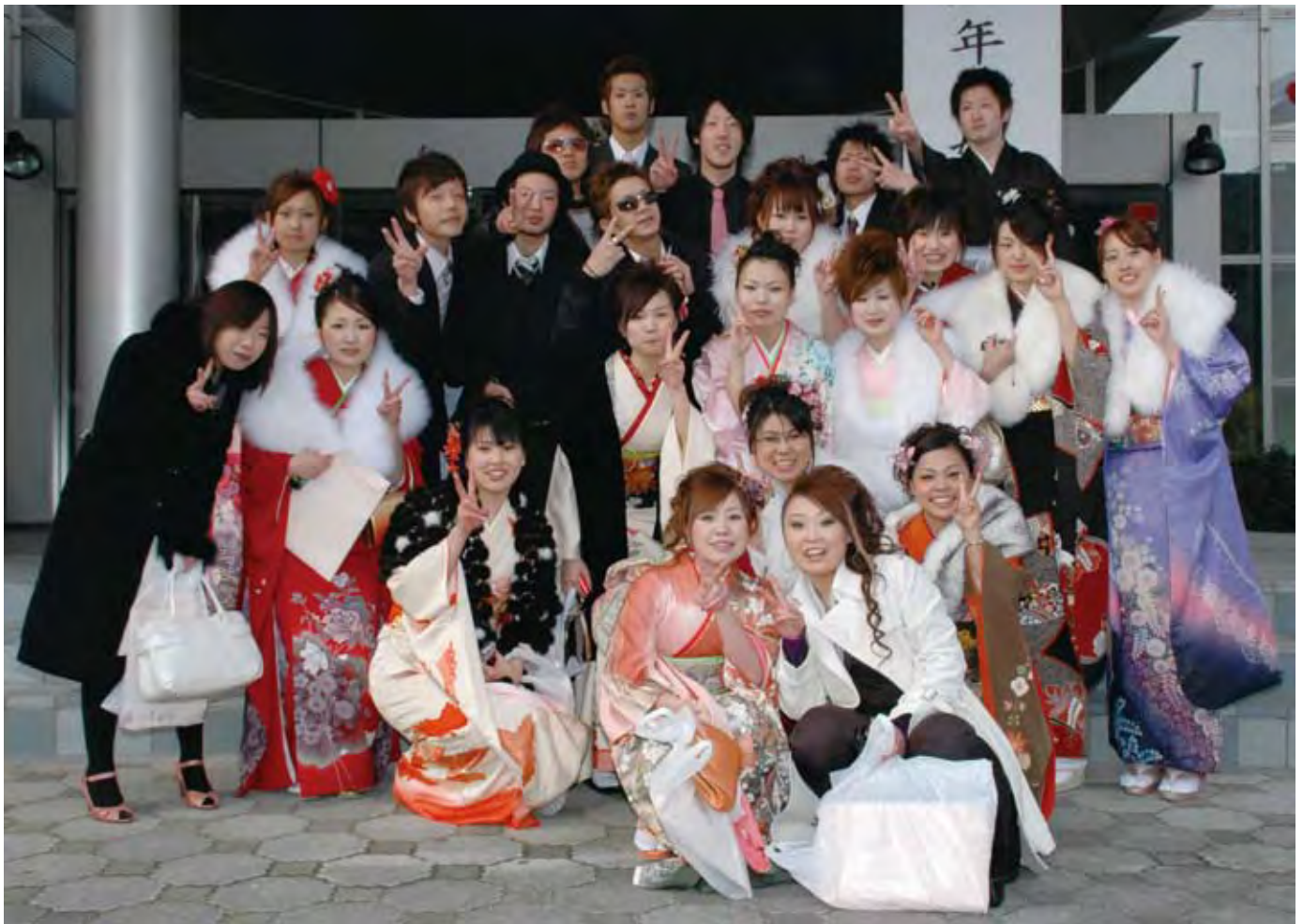
平成 19 年三好市成人式 (8,9 ページ)