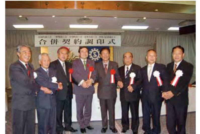
▲式には知事などが出席

三好市内の山城町、三野町、井川町、東祖谷、西祖谷山村の5つの商工会が、昨年の3月から協議を重ねた結果、合併することになり、12月12日、井川町のふるさと交流センターで調印式が行われました。5つの商工会の会長が合併契約書に署名し、来年4月1日に新しく「三好市商工会」を設立することが正式に決まりました。三好市にはほかに、阿波池田商工会議所がありますが、組織形態も法制度も違うため合併は難しく、一自治体内に並存することになります。