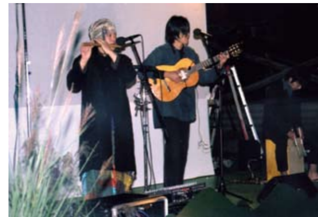
▲演奏会もまた風情がありました

10月8日夜、山城町平野の塩塚高原キャンプ場で月見の宴が開かれました。管理棟前広場に設けられた舞台上、影遊び劇団ジョイホナ公演をメインに、山城町の民話紙芝居、のこぎり奏者演奏会などが行われ、幻想的な雰囲気の中、参加者は宴を満喫しました。午後6時半すぎ、舞台後方から大きな満月が姿を現すと、観客から大きな歓声が上がりました。