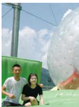
▼ 今年でゾープの営業は3年目を迎えました

8月27日、イカワエクスパークにおいて今年も四国放送ラジオの人気番組「めっさGO!」の公開ラジオ収録が行われました。お笑いタレント（チョップリン・OverDrive・DA-DA）と高畑産業観光部長とのクロストーク、漫才やリスナーとのゾープ同乗体験などがあり、公園内は笑いに包まれ、非常に盛り上がりました。