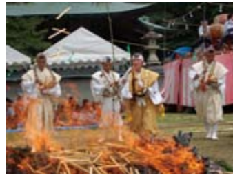
今年1年もどうか家内安全 ▶ でありますように

8月4日、池田町州津の箸蔵寺で「箸供養」が行われました。読経と太鼓の音が響き渡る中、護摩がたかれ、全国から寄せられた使用済みの箸約5千組が供養されました。山伏姿の行者が般若心経を唱えながら、炎の中に護摩木を次々と投げ込み、護摩木を燃やした灰の上を信者らが素足で歩く火渡りも行われました。