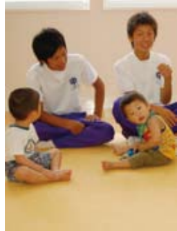
▼ 子どもたちはおおはしゃぎ

井川中学校の3年生が、西井川保育所を訪れ、子どもたちと水遊びをしたり、手作りのおもちゃで遊んだりしました。元気いっぱいの子もたちに、中学生らは圧倒されながらもとても優しく接していました。将来保育士になりたいとの声もあり、将来が頼もしい限りです。