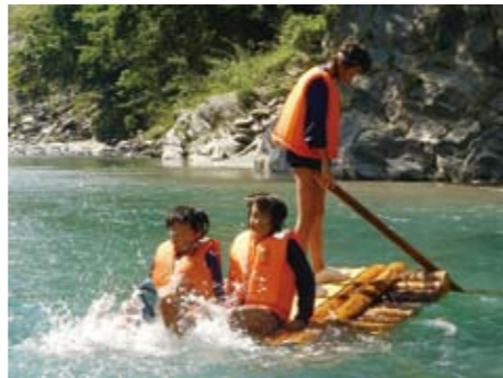
◀ 川の水は気持ちいいね

夏休みの一日、親たちが子どもの頃に楽しんだ川遊びを子どもたちに体験してもらおうと、親子体験教室が開催されました。柘之瀬小学校（東祖谷新居屋）の児童らが参加し、今は遊泳禁止となった川辺で、いかだ作りや水辺の生物捕りなどの川遊びを体験しました。