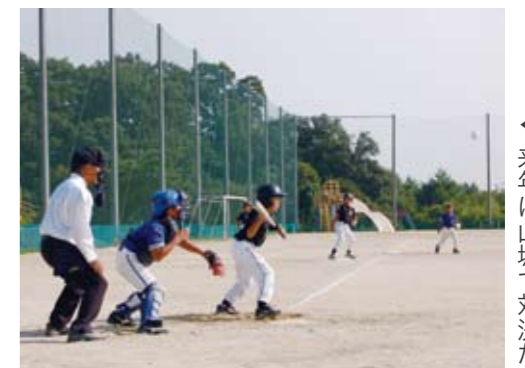
◀ 来年は山城で対決だ

両チームの選手も保護者もこの交流会を楽しみにしており、ずっと色褪せることなく続けて欲しいと思います。