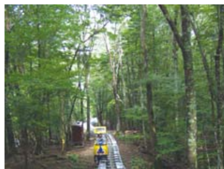
◀ リスや鹿に会えるかも

8月29日、三嶺の中腹、いやしの温泉郷周辺に奥祖谷観光周遊モノレール（延長4,600m、高低差590m、最大傾斜度40度、最長標高1,380m）がオープンしました。約1時間10分かけて自然の中をゆっくりと進み、森林浴を楽しむことができます。料金は大人1,500円、小人700円（12月末まで割引あり）となっています。