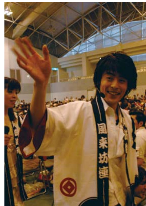
▲ 見事な阿波踊りも披露