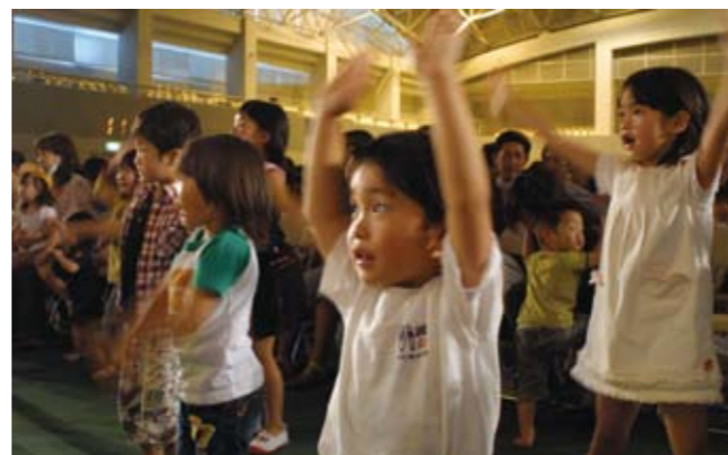
▲ 子どもたちはおおはしゃぎ

6月17日、「今井ゆうぞう君とぐ〜チョコランタンとあそぼ!!」が池田総合体育館で行なわれ、親子連れなど約3800人が集まりました。三好市池田町出身のタレント今井ゆうぞうさんや、NHKの人気番組のキャラクターらが出演し、子どもたちは一緒に歌ったり踊ったりして楽しい時間を過ごしました。