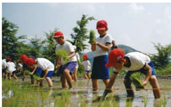
▲ 収穫が楽しみです

山城町大野にある長年放置されていた棚田（面積約1アール）を、大野小児童と地元の住民組織「大野いきいきだんだん」がよみがえらせました。よみがえった田に児童らが植えたのはもち米で、これからの収穫や餅つきなどを通して、伝統や自然を学んでいく予定です。