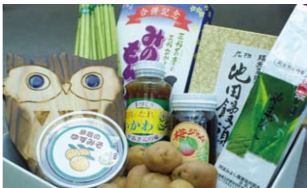
▲ お問い合わせは商工観光課（☎72-7620）まで

「池田やまびこふるさと会春の特産品」発送作業が行なわれ、全国の会員へ小包が送られました。今回は、三好市誕生後初めての発送ということで、市内各地の特産品9品目が詰め込まれました。