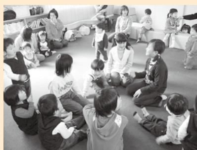
▲子育てサークル「お姉ちゃんと遊ぼう会」

三好市社会福祉協議会 三野支所(宮内) 電話 77-2882 FAX 76-2706