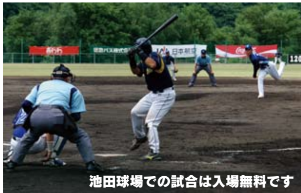
池田球場での試合は入場無料です

フレッシュスカップ 開催形式 4球団の総当りリーグ戦 参加チーム 徳島インディゴソックス 香川オリーブガイナース 愛媛マンダリンパイレーツ 高知ファイティングドックス 開催日程・球場 3月20日・21日 池田球場 3月22日 蔵本球場 お問い合わせ先 フレッシュスカップ事務局 (電話)088-692-1945