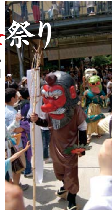
主催 四国の秘境山城・大歩危妖怪村 後援 峠山城しんこう(道の駅大歩危)