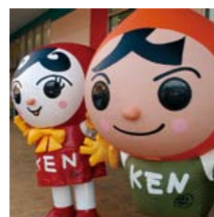
人KEN まもるくんと人KEN あゆみちゃん

12月4日、人権週間の始まりの日に市内商業施設で、三好市人権擁護委員会による街頭啓発が行われました。「育てよう一人一人の人権意識」をスローガンに人権擁護委員の活動や人権差別のない社会づくりを呼びかけるチラシや人権啓発グッズを市民の方々に配布しました。当日は法務局から「人KEN まもるくん・人KEN あゆみちゃん」も駆け付け街頭啓発に花を添えました。