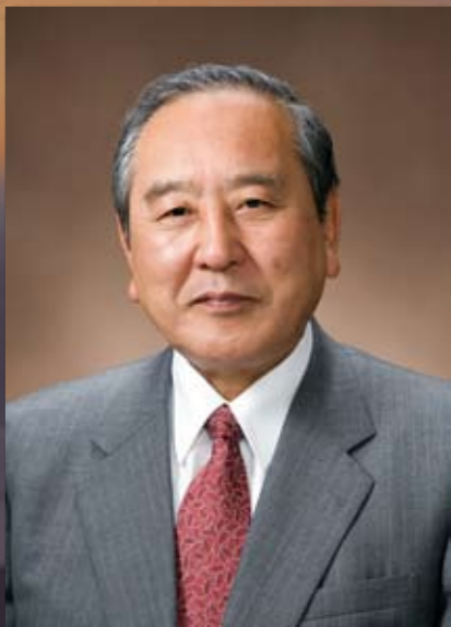
三好市長 俵徹太郎

新年あけましておめでとうござい ます。2009年のすがすがしい新 春をご家族お揃いでお迎えのこと と、心よりお慶び申し上げます。