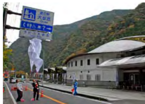
国道に設けられた看板を除幕

ラピス大歩危は石の博物館などを設けた施設として1996年に開館し、来場者の増加を図ろうと、今回道の駅に登録申請しました。