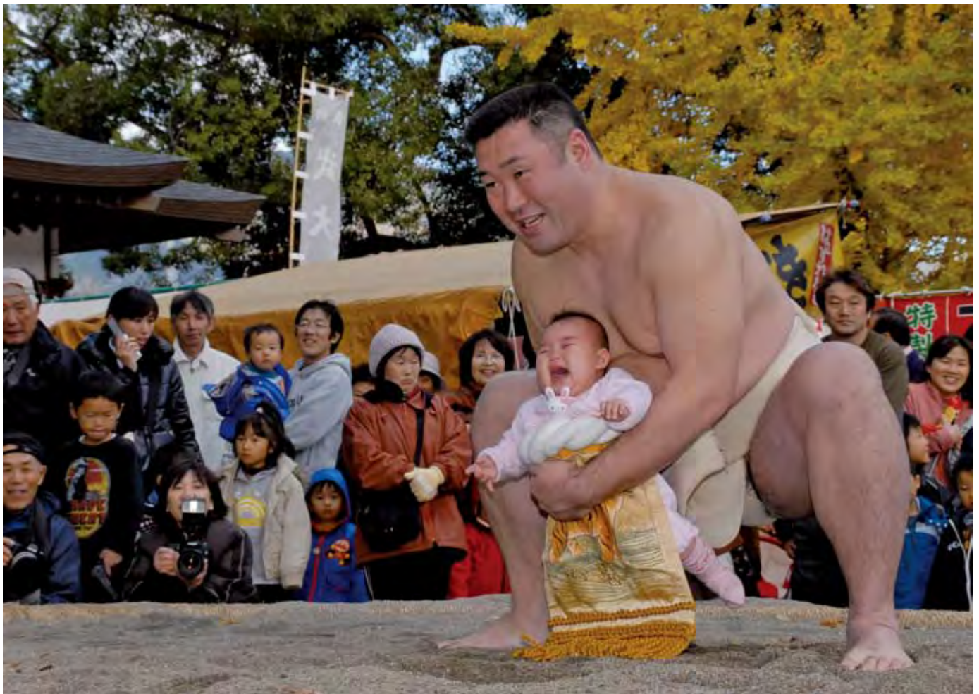
おてんのはんの市（三野町）

三好市職員の給与公表 ペットボトルの分別方法 市営住宅入居者募集 叙勲受章者紹介 かずら橋三世代夫婦募集 まちかどフォトニュース