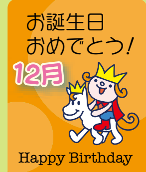
お誕生日 おめでとう! 12月 Happy Birthday