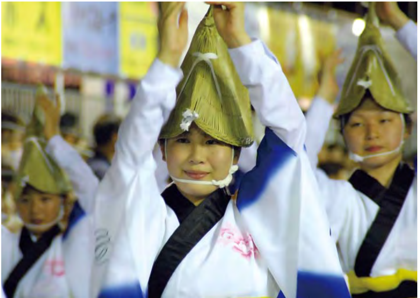
いけだ阿波おどり 2008